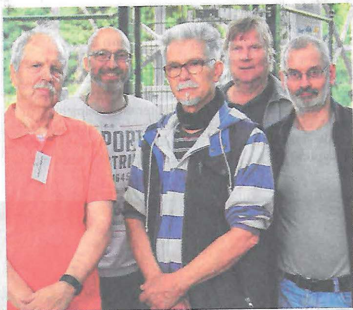
Die Mitglieder der Allianz Schnelsen Nord informierten die Bürger über die neusten Entwicklungen.

Gegen neue Technologien möchten sich die Betroffenen gar nicht stellen. Doch es gibt ein klares Ziel: Der Rückbau des Funkturms. Laut Flügge gebe es genügend freie Fläche, um woanders einen Funkmast zu errichten. Über die Kosten eines Abbaus habe er sich bereits informiert. „Das würde gerade einmal 19 000 Euro kosten“, erläu-